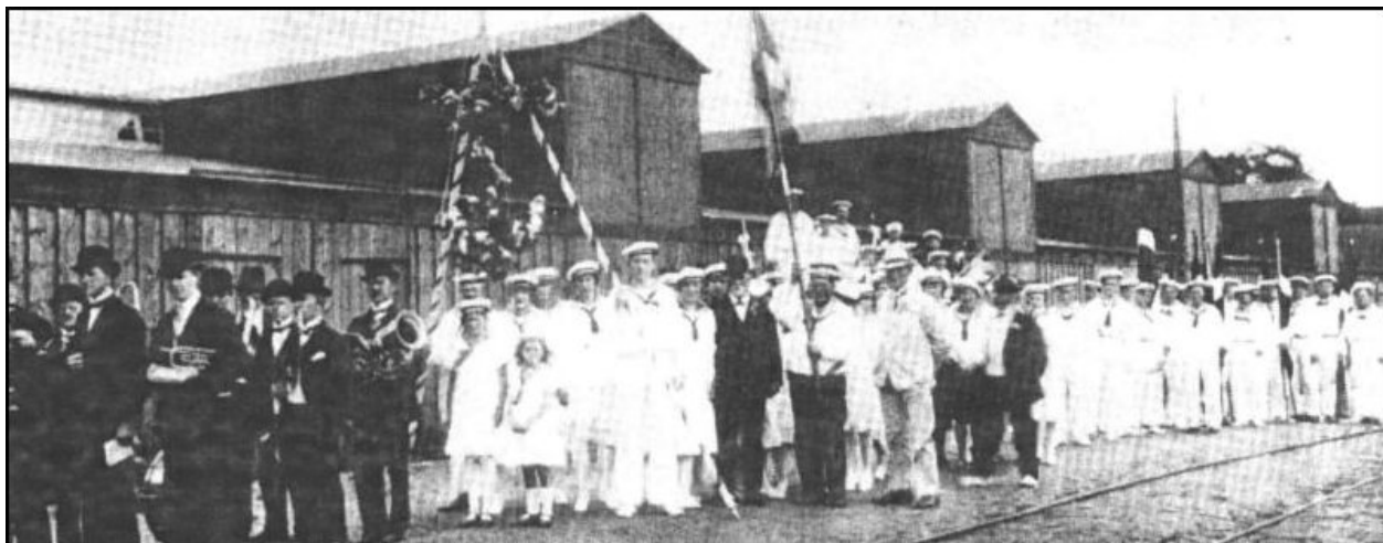
Optog og dystløb ved købstadsjubilæet i 1926

Bygningen er for længst revet ned - den lå på en nabogrund til banegården.