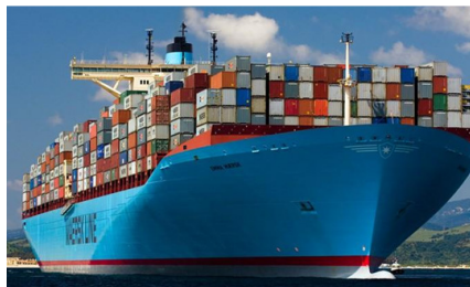
M/S Emma Mærsk